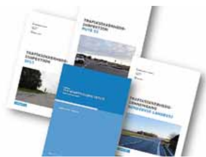
Figur 1. Ny håndbog i trafiksikkerhedsinspektion og eksempler på trafiksikkerhedsinspektioner.

Trafiksikkerhedsinspektionens afrapportering indeholder forslag til, hvordan trafiksikkerheden kan forbedres. Færdselssikkerhedskommissionens handlingsplan anbefaler at bruge trafiksikkerhedsinspektion til at forbedre trafiksikkerheden på de danske veje.