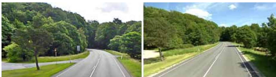
Figur 2. Eksempel på lukning af overkørsel til parkeringsplads umiddelbart efter kurve efter anbefaling i en trafiksikkerhedsinspektion. Foto før og efter.

I modsætning til trafiksikkerhedsrevisioner, som behandler ombygninger og nyanlæg, er der mulighed for i trafiksikkerhedsinspektioner kun at se nærmere på udvalgte problemstillinger eller forhold for udvalgte trafikantgrupper. Det kunne f.eks. være faste genstande inden for sikkerhedszonen eller forhold for cyklister.