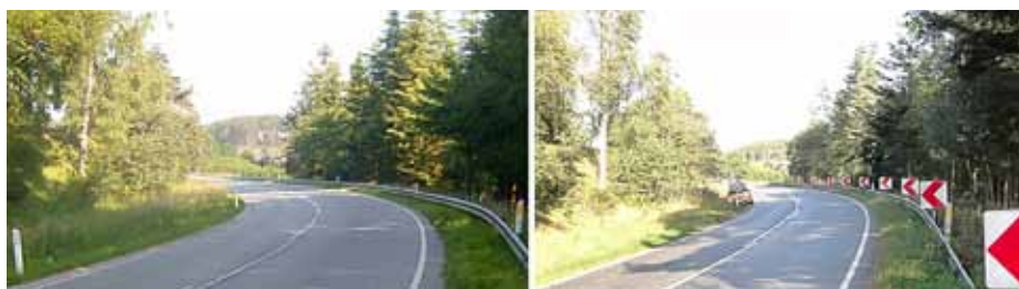
Figur 4. Eksempel på etablering af baggrundsafmærkning efter trafikikkerhedsinspektion. Foto før og efter.

Med udgivelsen af Håndbog i trafikikkerhedsrevision er der blevet behov for at opdatere den eksisterende Håndbog i trafikikkerhedsrevision og -inspektion. Dette arbejde er igangsat og forventes offentliggjort i løbet af 2015.