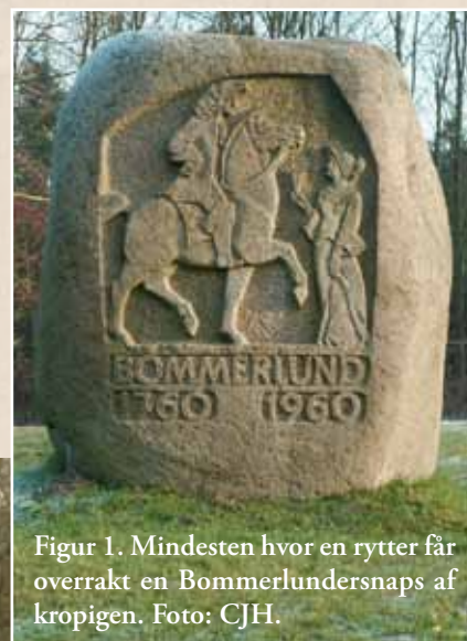
Figur 1. Mindesten hvor en rytter får overrakt en Bommerlundersnaps af kropigen.

Forfatteren lægger ikke skjul på, at han i 1972 stemte for Fællesmarkedet og dermed sikrede sig, at man igen kunne købe Bommerlundersnaps uden ekstra afgift. Men som min gamle ven og EF modstander, overlægen fra Kolding sagde: Det er sandelig første gang, jeg hører en positiv begrundelse for at gå ind i Fællesmarkedet!