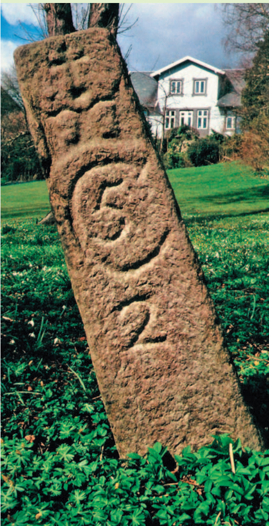
Figur 1. Ole Rømer Helmilestone, 2 mil. den 7. apr il 1997.

Af arkitekt Jens Johansen, Søllerød Museum jjh@sollerod.dk